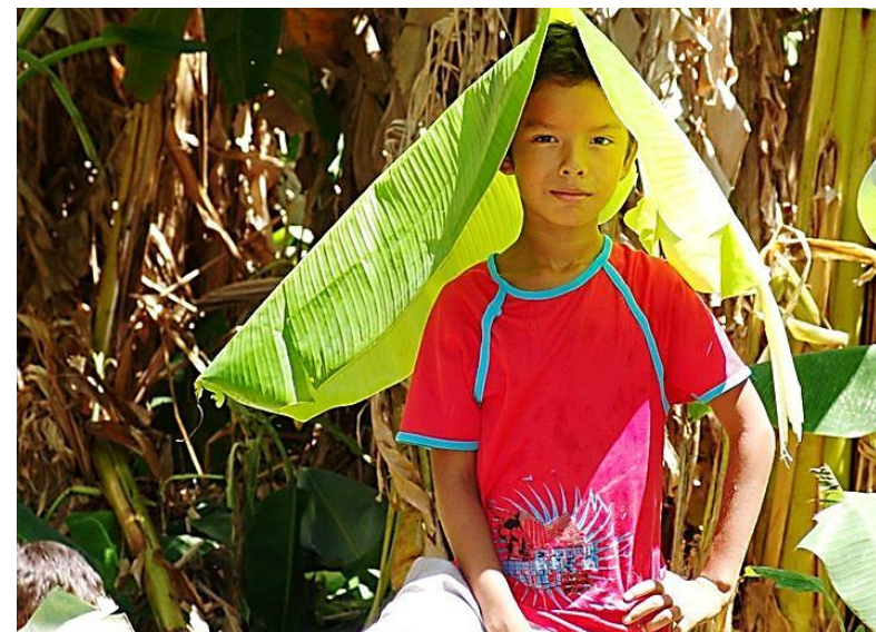
Imagem: Sílvia Sousa