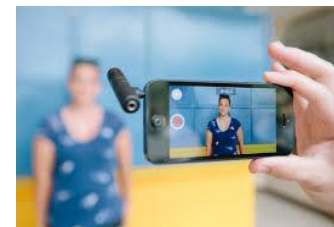
Gravador e/ou microfone portátil (direcional e/ou lapela)