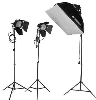
set de luz