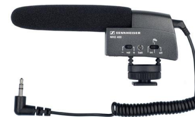
captação de som