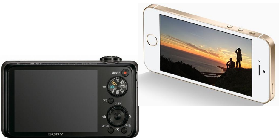
celular ou smartphone ou câmera fotográfica ou tablet ou outro equipamento compatível

vez mais, com equipamentos compactos e mais simples, que entregam os resultados esperados, com eficiência e qualidade. Além de inúmeras facilidades.